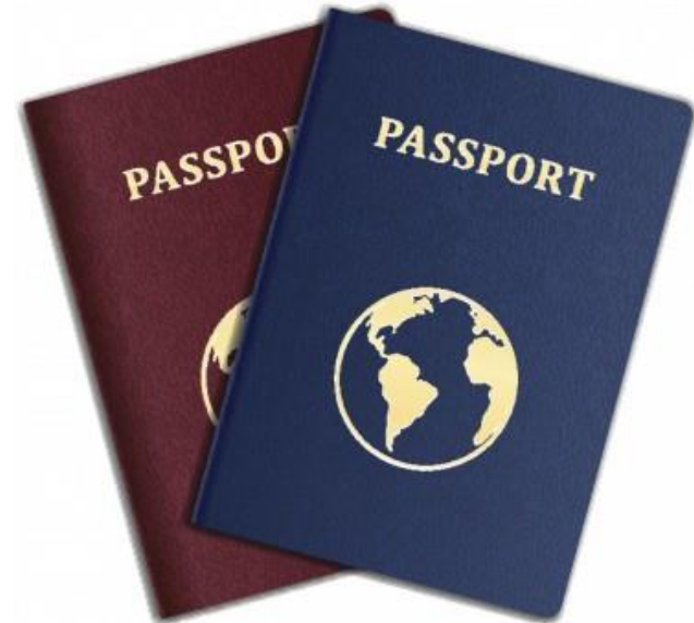
Document of Identification with photo